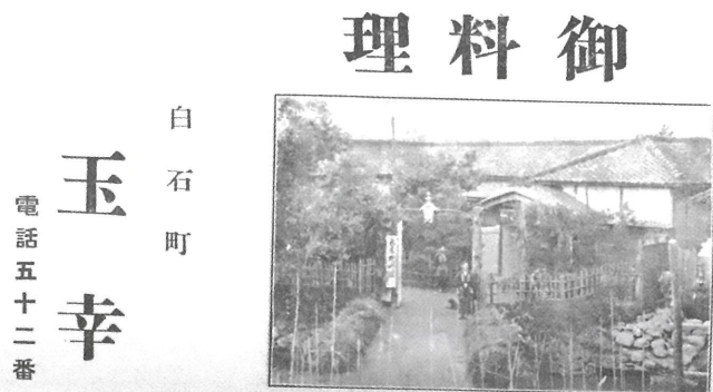
明治45年(1912) 広告：料亭玉幸

明治以降の白石では、地域新聞の発行や、地元の研究者による多くの歴史研究書が出版されてきました。本文の重要性はもちろんですが、そのなかには現在まで続く商店などの広告も掲載されています。