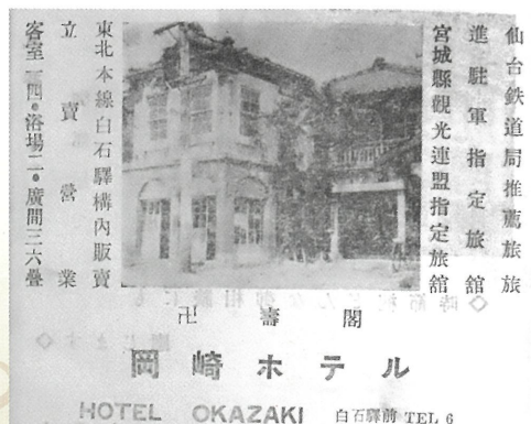
昭和25年(1950) 広告：岡崎ホテル