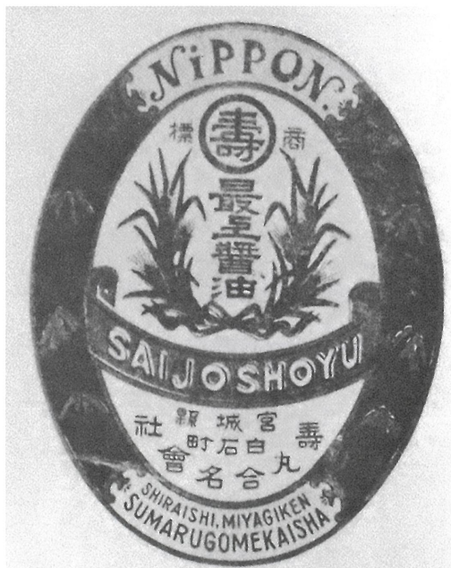
明治45年(1912) 広告：寿丸合名会社