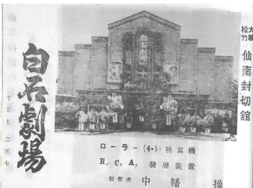
昭和25年(1950) 広告：白石劇場