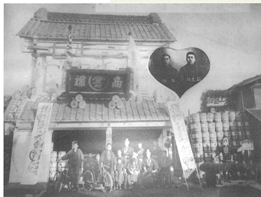
明治43年(1910) 寿丸合名会社移転記念