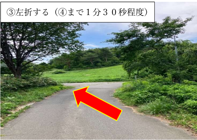
③左折する (④まで1分30秒程度)