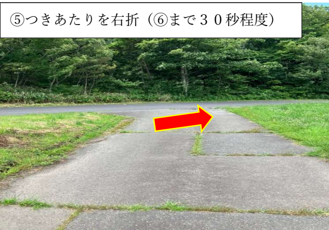
⑤つきあたりを右折 (⑥まで30秒程度)