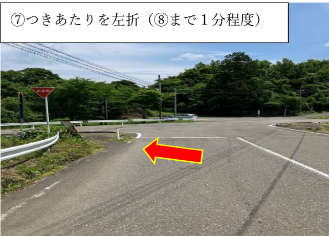
⑦つきあたりを左折 (⑧まで1分程度)