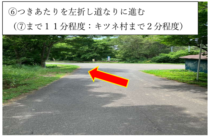
⑥つきあたりを左折し道なりに進む (⑦まで11分程度：キツネ村まで2分程度)