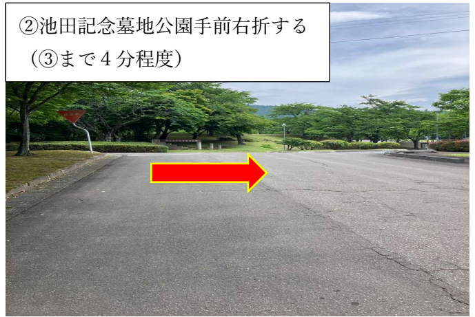
②池田記念墓地公園手前右折する (③まで4分程度)