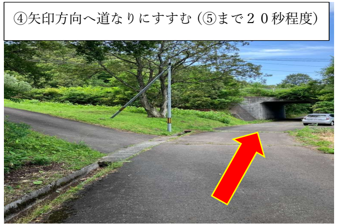
④矢印方向へ道なりにすすむ (⑤まで20秒程度)