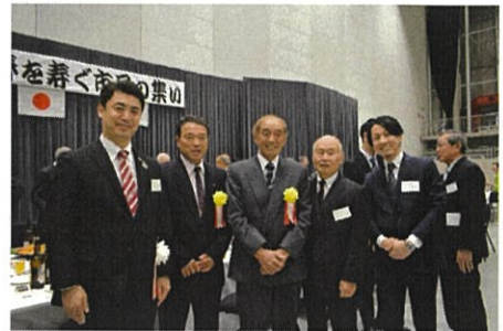
新春を寿ぐ市民の集い