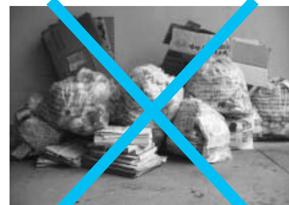
ごみが混在している状態