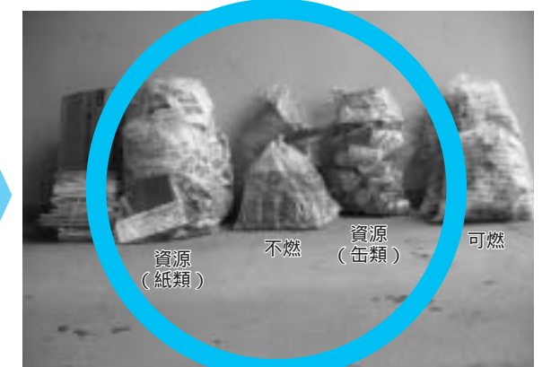
種類ごとに分かれている