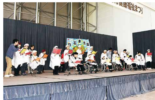
▲ステージで歌を披露した白石陽光園の皆さん

11月3日、「第9回白石市健康福祉まつり」をホワイトキューブで開催しました。障がいのあるなしに関わらず地域で暮らせる社会、からだも心も健康であることの大切さに気づく社会づくりを目指して開催しているこのイベント。会場には、各種健診や車いす・手話などの体験、福祉団体による歌や太鼓の披露、作品展示などの多彩なコーナーが設けられ、約1,900人の来場者でにぎわいました。会場には中高生や大学生のボランティアも参加し、さまざまな団体や世代が集まって交流を深め、健康や福祉を見つめるイベントとなりました。