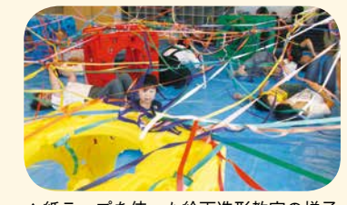
▲紙テープを使った絵画造形教室の様子