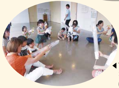
サンサンるーむでは紙コップと傘袋で風船おぼけを作りました