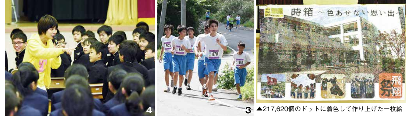
1_東京フィルの指揮者を体験。独特?なリズムでハンガリー舞曲第5番を見事に演奏！ 2・3_この経験があれば必ずや人生の激坂も登り切れるはず 4_講演の合間の質問コーナーでは、佐久間さんのプライベートについての質問も飛び出し、会場は盛り上がりました

白石中学校は、昭和22年の開校から創立70周年を迎え、本年度さまざまな記念行事が行われました。9月10日の「第31回しろいし蔵王高原マラソン大会」には、全校生徒が参加。319人があきらめずに激坂を駆け上りました。走り終えた生徒は「つらかったですが、みんなで支え合って走りきれてよかったです」と話してくれました。9月29日の「芸術鑑賞会」では、東京フィルハーモニー交響楽団による公演が行われ、約80人によ