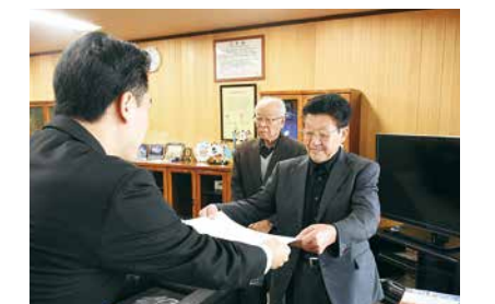
▲受納書を受け取る113カラオケ会の皆さん