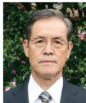
■秋の危険業務従事者叙勲 瑞宝双光章

45年の永きにわたり、日本全国の電力会社の送電線の建設、鉄塔の建て替え工事などに従事しています。平成5年からは、高度な熟練技術や技能を継承させる業務にも従事され、次世代若手育成伝承のためご尽力されています。