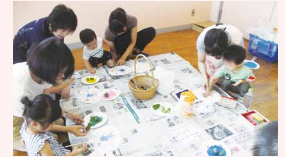
▲大平公民館でのあいあいランド。野菜スタンプのオリジナルうちわを作りました