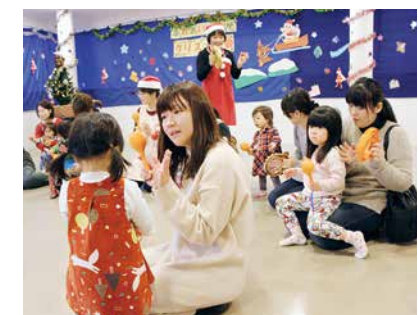
▲親子でふれあいながら「サンタさんこないかなあ」と待っていました