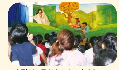
▲人形劇は子どもたちに大人気