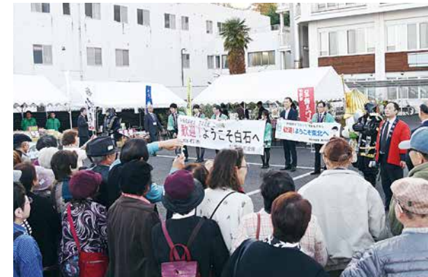
▲ツアー客を出迎えた仙南信金と市職員、地場産品ブースの皆さん

11月7日、神奈川県平塚信用金庫のバスツアー客約160人が白石市を訪れました。このツアーは神奈川県平塚信用金庫が企画する年金受給者を対象としたツアーで、本市と包括連携協定を結んだ仙南信用金庫が、全国の信用金庫ネットワークを活用して本市に誘致したものです。ツアー客は城下広場で歓迎を受けたあと、白石城を見学し、城下広場に設営された物販ブースで買い物を楽しんでいきました。このツアーは1泊2日の行程で白石、仙台、松島などを巡り、16日までに6回、計約700人が本市を訪れました。