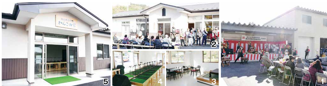
1_大鷹沢子ども太鼓の演奏が落成式に花を添えた 2_旧犬卒都婆公会堂の場所に建築された農業研修所 3_産直市場内には食堂が設けられており地元食材を使った料理が提供されます 4_もうすぐ地元の農産物や加工品が並びます 5_オープンを待つ羽山産直市場「わんこの家」