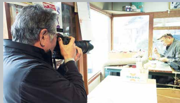
▲11月に「こけしづくり」を撮影した様子

カレンダー・ポスター・コマーシャルなどの広告や雑誌・写真集の撮影を中心にフリーのフォトグラファーとして活動。様々な分野の審査員、政府の諮問委員なども務める。