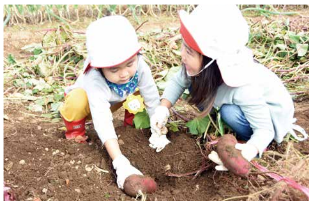
▲土を掘ると出てくるサツマイモに大興奮の園児たち

大きなサツマイモを掘り出した園児は、「大きいのが採れてうれしかったです。おうちでシチューにして食べたいです」と笑顔で話してくれました。