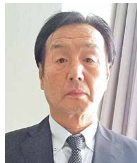
■秋の叙勲 瑞宝単光章