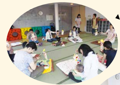
ニコニコるーむでこいのぼりをつくったよ

また、身の回りの材料を使って簡単なおもちゃを作ったり、絵本を読み聞かせたりします。同じ年齢のお子さんを持つ親同士の友達づくり・仲間づくりの場にもなっています。