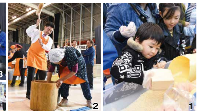
1_大人気新米すくい取りには大人から子どもまで大勢の人が参加 2_農協女性部による餅つき。山田市長もきねを手にとった！ 3_みちのく真田ゆかりの地の物産が当たる抽選会 4_季節の野菜が並んだ農産物コンテスト 5_市が特産化を目指すスキイモの活用策の研究成果を紹介し試食や販売も行った柴田農林高等学校