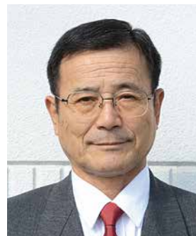
■秋の危険業務従事者叙勲 瑞宝単光章

昭和47年4月に仙南地域広域行政事務組合消防士となられて以来、40年の永きにわたり奉職されました。この間、柴田消防署長などの要職を務められ、火災予防と市民の生命、財産の保全のためご尽力されました。