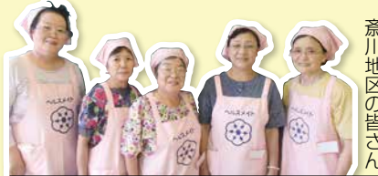
斎川地区の皆さん

*食べ物からとったカルシウムを骨に蓄えるためには運動が必要です。手軽なウォーキングなどから始めましょう。