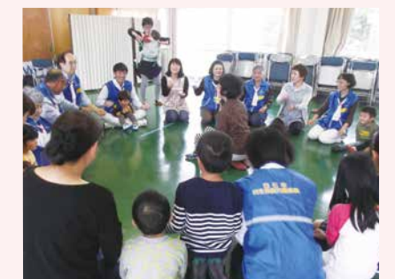
▲小原公民館で開催したわくわくランド。民生委員児童委員の皆さんと当てっこあそび

地域のお子さんを対象にした地区民生委員児童委員協議会などが主催する親子ふれあい遊びの事業に参加しています。手作りおもちゃや、わらべうた、パルンなどで和気あいあい親子遊びを楽しめます。本年度は、白川・小原・大平地区で開催しました。