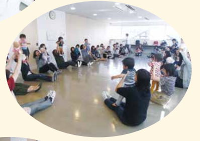
ランランるーむでは「バスに乗って」の歌に合わせて音楽あそび