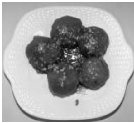
エネルギー216kcal/たんぱく質9.7g/塩分0.3g