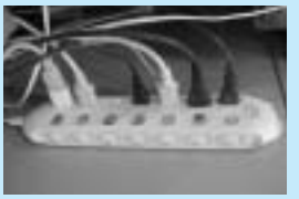
待機時電力カット用コンセント

⑥ 電気製品の待機時消費電力は決して小さくありません(約10%)。リモコンでスイッチを切つても電力を消費する機器がたくさんあります。長時間使用しないものはプラグを抜きましょう。待機時電力カット用コンセントを使用すると便利です。