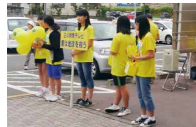
▲募金を呼び掛ける中高生ボランティア