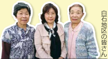
白石地区の皆さん