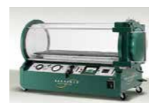
②当院で導入している高気圧酸素治療装置(BARA-MED)

「網膜動脈閉塞症」という病気をご存じですか? なかなか馴染みのない病名ですが、実は急いで治療を開始する必要があります。この病気の代表格です。この病気が、網膜動脈が閉塞し、光を脳に伝えるために働く網膜に血流障害が起きる病気です(①)。その原因の多くは、網膜動脈の動脈硬化や心臓の中で作られた血栓などの塊(塞栓子)が詰まることによって生じます。症状として、「突然、片目が急に真っ暗になった」と自覚される患者さんが多くいます。この病気の怖い点は、「痛