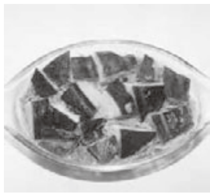
エネルギー212kcal/たんぱく質11.5g/塩分1.4g