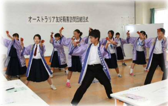
オーストラリア友好親善訪問団結団式