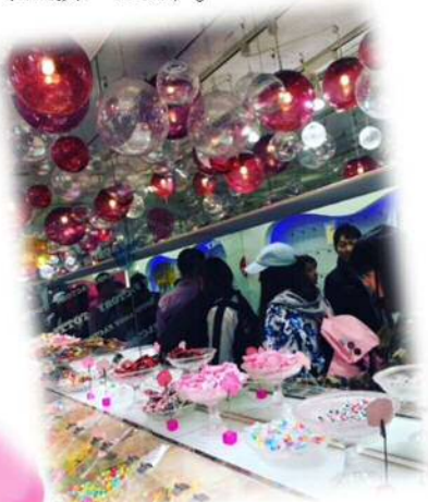
▲トッティ キャンディ ファクトリー 東京・原宿店 (かわいいお菓子がたくさんあるお店で、フワフワした綿菓子が話題に！)