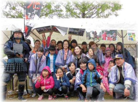
▲フランスはどこにいるかなあ・・・@東北大学国際祭り

❖梅雨の季節がやってきました。みなさんは、何か快適に過ごす工夫をしていますか？❖