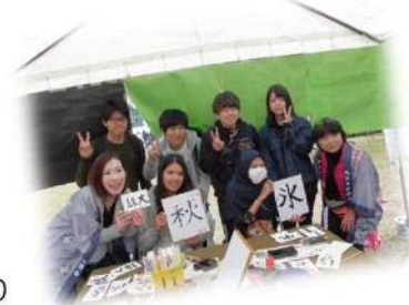
◀書道チーム 体験者と一緒に～♡

フランスの5月は楽しかったようですよ～(^-)-☆ 5月14日の東北大学国際祭りにも書道塾のメンバーの 一人として参加してくれました!(^_^)! 書道体験は大好評!!