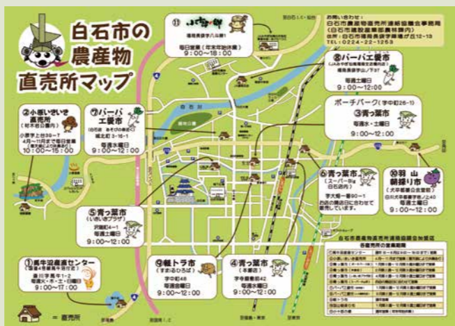
▲裏面は、好評の農産物カレンダーを掲載!

持ち歩きに便利なポケットサイズ版も、各直売所や白石市観光案内所、市役所で配布中! マップを手に、各直売所の旬の野菜巡りをしてみませんか? ご来店をお待ちしています。