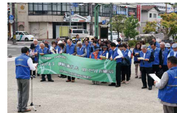
▲出発式で行動宣言を唱和する民生委員・児童委員の皆さん

民生委員制度が創設されて100周年を迎えた5月12日、市内の民生委員・児童委員約90人がすみひろばに集まり、高齢者世帯などを対象とした一斉訪問活動の出発式を行いました。対象は一人暮らしや寝たきりなどの高齢者世帯など約2,000世帯で、各地域の委員がご家庭を訪問し、相談に応じて必要な支援を行っていきます。出発式では「広げよう 地域に根ざした 思いやり」と行動宣言を全員で読み上げ、これからの活動の意識高揚を図りました。日常生活での困りごとや児童に関する相談は、各地域の民生委員・児童委員にご相談ください。