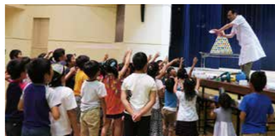
▲同会主催事業遊びの達人養成講座「おもしろサイエンスショー」の様子