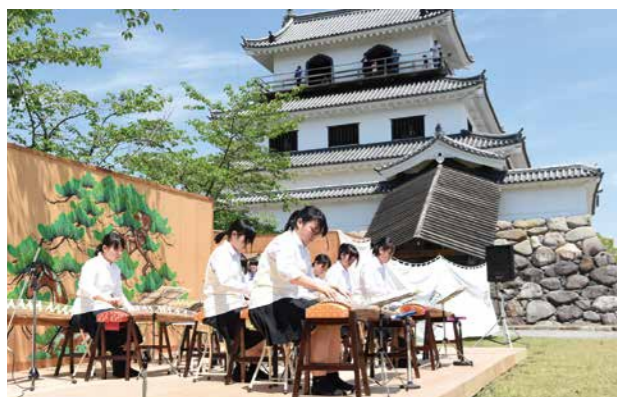
▲なじみある曲を箏で演奏する白石高等学校箏曲部の皆さん

野点では和菓子と抹茶が振る舞われ、青空と新緑のなかで伝統芸能に触れながら、大人から子どもまで楽しいひとときを過ごしていました。