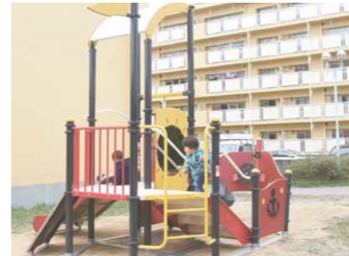
▲子育て応援住宅敷地内に設置された遊具で元気に遊ぶ子どもたち