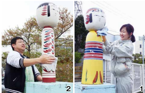
1・2 心を込めてこけしを清掃する工人たち

4月19日、市内のこけし工人たちが、いきいきプラザ前にある桜橋の欄干上のこけし像を清掃しました。この活動は、全日本こけしコンクールを前に、訪れた観光客をきれいなこけしでお出迎えしようと平成24年から実施。桜橋のほか、白石第一高架橋や弥治郎橋の橋梁上部に設置しているこけし像計12基の汚れをふき取ってきれいにしました。作業に参加した工人は「たくさんのお客さんがこけしコンクールに来てくれて、こけしを好きになってくれるとうれしいですね」とさわやかな笑顔で話してくれました。