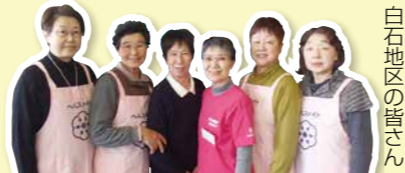
白石地区の皆さん