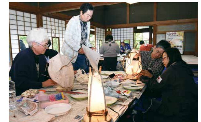
▲思い思いのあかりを作る参加者たち

5月14日、壽丸屋敷で「白石和紙あかり製作ワークショップ」が開催されました。この催しは、まちづくり団体「蔵富人」が主催し、市内のほか、仙台市や蔵王町、岩手県一関市などから21人が参加。木の枝などで骨組みを作り、蔵富人が栽培から手がけた17種類の和紙を使って、思い思いのあかり作りを楽しんでいました。製作した作品は、8月の夏まつりに合わせて壽丸屋敷で展示して市民の皆さんにご覧いただけます。またワークショップは、第2回を6月18日に、第3回を7月9日に開催。興味のある方はぜひ参加してみてください。