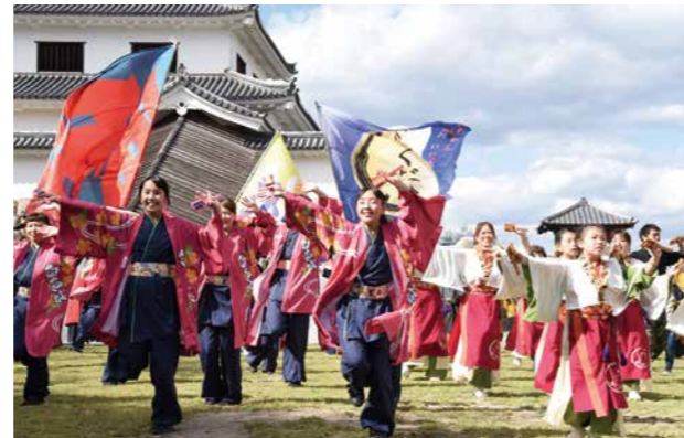
▲鳴子を手に笑顔で踊るよさこい団体の皆さん

来場者は「今年は参加団体が多くて見応えがありました。よさこいを見ると元気をもらえるので、来年も期待しています」と話してくれました。