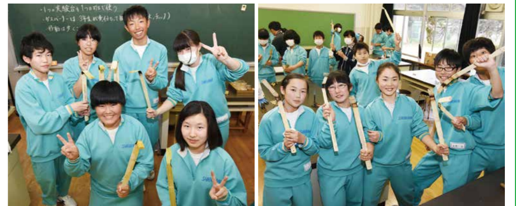
▲1本1本それぞれに個性のある孫の手が完成し、ポーズをとって記念撮影する白川中の生徒たち

白川中学校には、約40年前から続く伝統行事「孫の手製作」があります。この活動は、お年寄りを敬う心を育み、自然と触れ合うことを目的に実施。製作した孫の手は、毎年、地区の敬老会で米寿の方へプレゼントされています。4月26日、全校生徒37人が6つの縦割り班に分かれて製作をスタート。3年生が中心となり、下級生に作り方のポイントなどを指導しながら1本1本心を込めて作っていきました。一日で52本の孫の手が完成。後日、メッセージを添え包装した孫の手を、代表生徒が白川公民館に届けました。また、5月20日には、長年の活動が評価され、一般社団法人「日本善行会」から表彰され、明治神宮での表彰式に出席。これからもお年寄りの笑顔のためこの活動を受け継いでいきます。