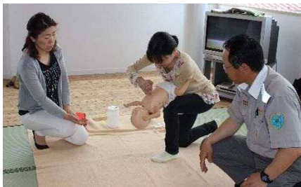
▲昨年度開催時に人形を使って乳児への心肺蘇生法を実践する参加者