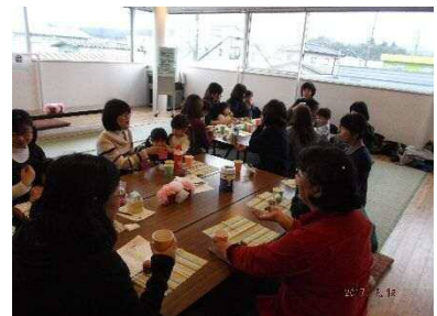
事例発表会でのファミサポカフェの様子