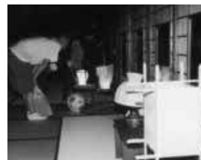
▲白石和紙あかり展示会（壽丸屋敷）