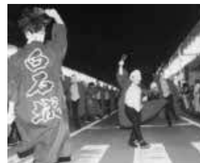
▲白石音頭パレード 各団体の趣向を凝らした衣装や踊りに観客も大満足でした

恒例の白石夏まつりが8月11日から20日にかけて開催され、白石音頭パレードをはじめ、流しうーめんやはしご乗り、花火大会など、多彩な催しで白石の夏を盛り上げました。