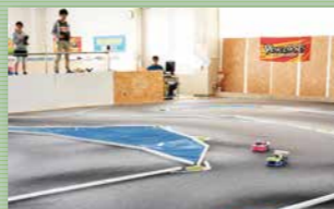
▲専門スタッフがいるサーキット場は東北ではここだけ！毎月1回レースを開催しています

カツマボウル（白石市大平森合字森合沖160） 職場の親睦会や子ども会行事にボウリングをしませんか？ボウリング場の他に、本格ラジコンサーキット場が併設。県外からもお客さんが多く来場しています。 ●営業時間 10:00～23:00（定休日 木曜日） ●料金 1ゲーム一般600円、中・高・大学生500円、小学生以下400円 ●電話 0224-26-2250