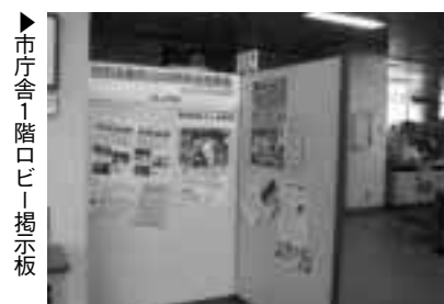
市庁舎1階ロビー掲示板

記念事業などに関する情報・お知らせは市庁舎1階ロビー掲示板やホームページでもご覧いただけます。