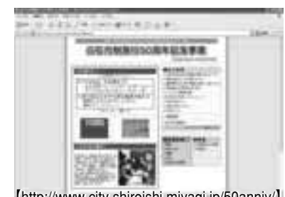
【 http://www.city.shiroishi.miyagi.jp/50anniv/ 】