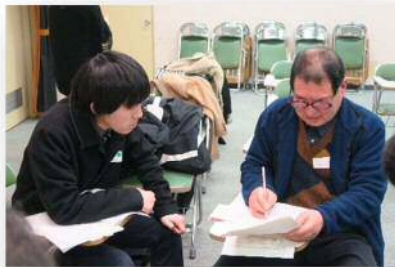
◀教わったことを必死に？書いていますよ(´-`)☆