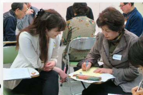
▲とても丁寧に教えています▼