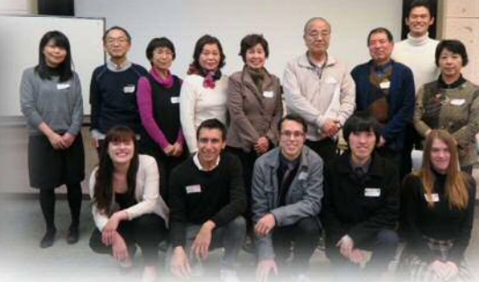
▲全員でパチリ！みんないい顔しています！