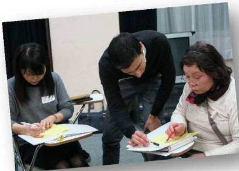
▲スピーチの原稿を書いています(´-`)☆