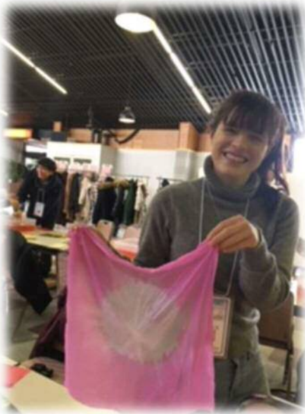
▲高畠町で紅花染めに挑戦しました