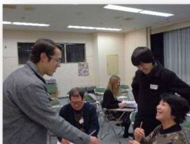
▲「英会話、とっても楽しいわ！」