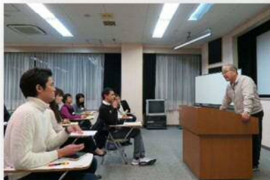
▲上級者の、聴衆の反応を見ながらのスピーチ、原稿なし！さすが～！！