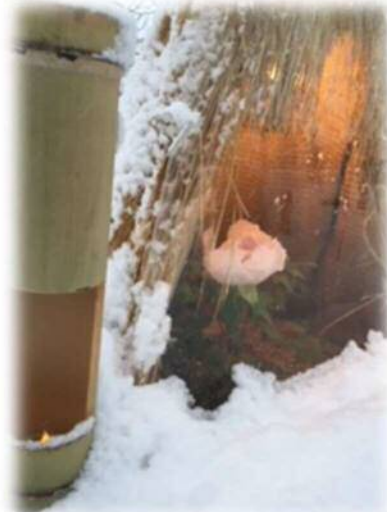
▲まほろば冬咲き牡丹まつり（山形県高畠町で）