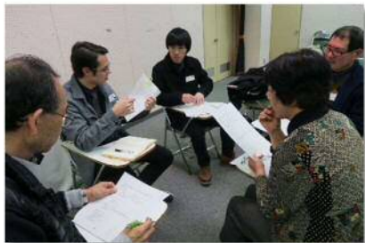
▲コツや役立つキーフレーズを教わっています

2016年度公民館講座で英会話（初級・中級）を学んだ方々を主に対象に、前年度のまとめとして ALT との会話に挑戦しました。当日はレベル別にグループを作り「今年の私の英語学習の成果について・来年の目標」をテーマに、ALT からスピーチの組み立て等を教わりながら、1人ずつスピーチをしました！ 当日の様子を、写真でどうぞご覧ください～い！