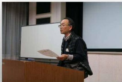
▲ゆっくりと落ち着いたスピーチでした