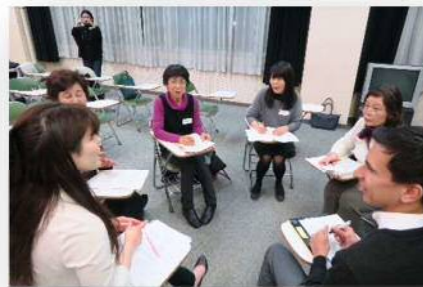
▲初級グループ、アイスブレイク中(´^`)

発行/白石市国際交流協会（白石市役所総務課内）TEL 0224-22-1331 FAX 0224-24-4861