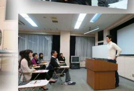
▲ユーモアを入れたスピーチ！