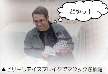
▲ピリーはアイスブレイクでマジックを披露！