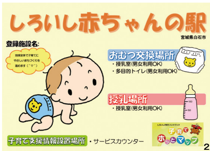
1_ふれあいプラザのおむつ交換所 2_「しろいし赤ちゃんの駅」の表示物イメージ。登録施設入口などに掲示しています

乳幼児と保護者の方などが、おむつの交換や授乳をする場合はどなたでも施設を利用できますので、気軽にお立ち寄りください。