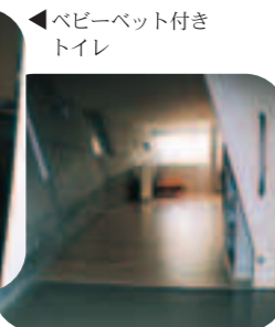
▲段差のない入り口（プレイルーム）