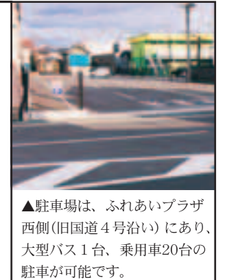
▲駐車場は、ふれあいプラザ西側(旧国道4号沿い)にあり、大型バス1台、乗用車20台の駐車が可能です。