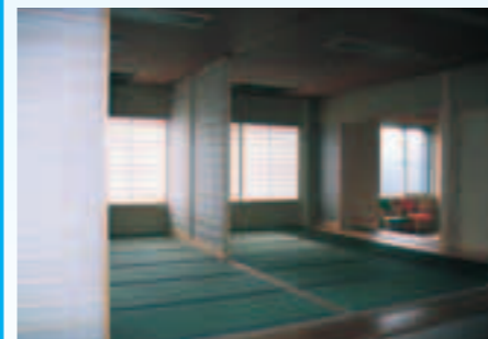
▲ゆったりとくつろげる日本間(利用者の動線を考慮して、すぐ隣に浴室を配置)