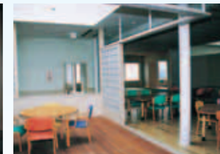
▲光庭から暖かい光が差し込む清潔感にあふれた室内(床暖房つき)