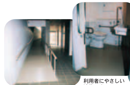
▲2階まで続くスロープ