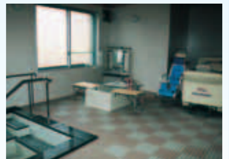
▲一般浴、個浴、特浴の3種類がそろった浴室(車いすの方も利用できます)