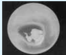
▲2000年10月 南極上空のオゾンホール (中央の穴のあいている部分)

この人間が自ら作り出した新たな脅威。私たちは乗り越えることができるのでしょうか。