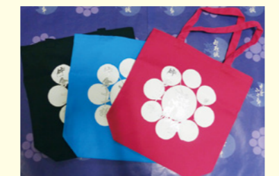
▲片倉トートバック 3色・各1,620円 絶賛販売中です!

アリーナー一般開放・トレーニングルーム開放日程は、ホームページまたはキューブ窓口までお問い合わせください。 http://www.shiro-f.jp/whitecube