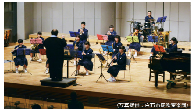
▲大会のほか地域活動にも積極的に参加し演奏を披露しています(平成28年10月10日白石城下町コンサート)