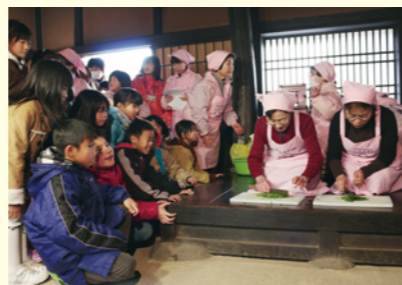
▲「七草なずな」を歌いながら調理するヘルスマイト白石の皆さん