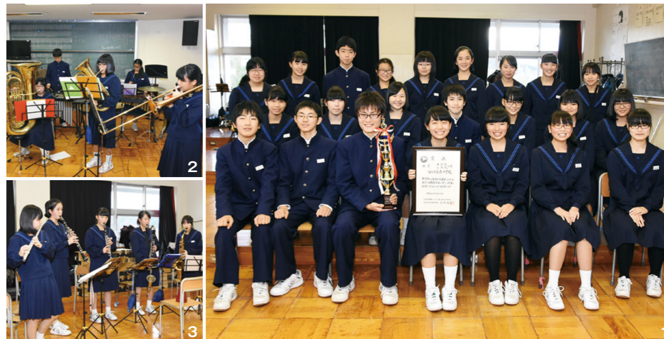
1_部長とクラスの席が隣だったという理由でメンバーに誘われた楽器未経験の野球部員とバレー部員の2人に加え、全員で笑顔の記念撮影 2・3_この日は、おもにパートに分かれての練習。パートリーダーを中心に、話し合いながら自分たちで練習を進めていきました

東 中学校吹奏楽部は部員が22人。その中には、現任部活を引退した3年生が8人います。これに野球部とバレー部からの助っ人2人を加えたメンバーが、昨年9月11日に郡山市文化センター(福島県)で開催された「全日本吹奏楽コンクール東北大会」で創部史上最高の銀賞を獲得しました。昨年1月に自由曲の楽譜を配られてから半年間、コツコツと練習を積み重ねてきた成果でした。一昨年の同コンクール地区大会は、金賞を獲得するも代表にはなれず県大会出場を逃し悔しい思いをした部員たち。顧問の黒田先生から「練習で泣いてもいいから本番で笑えるように練習しよう」の言葉を胸に、平日はもちろん、土日は早朝から夕方まで練習に打ち込みました。「東北大会銀賞獲得」は全員でつかみ取った汗と涙の結晶です。東中吹奏楽部は、これからも周囲の人たちへの感謝を忘れず素晴らしい音楽を作っていきます。