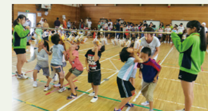
▲子ども達も参加する福岡地区民体育大会