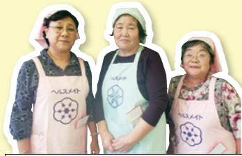
斎川地区の皆さん