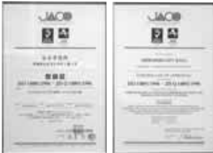
▲ ISO14001 登録証

今後もこのシステムを維持・管理するとともに、「白石らしさ」である歴史ある水の文化と緑の自然を後世に引き継ぐため、10年間にもわたる産業廃棄物最終処分場反対闘争を今後も粘り強く継続していくなど、「くらし日本一」の住み良い環境保全に努めていきます。