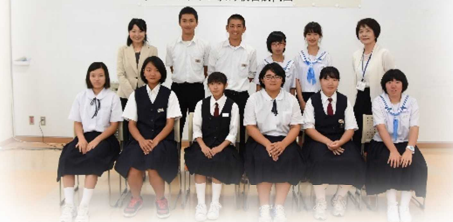
オーストラリア友好親善訪問団結団式