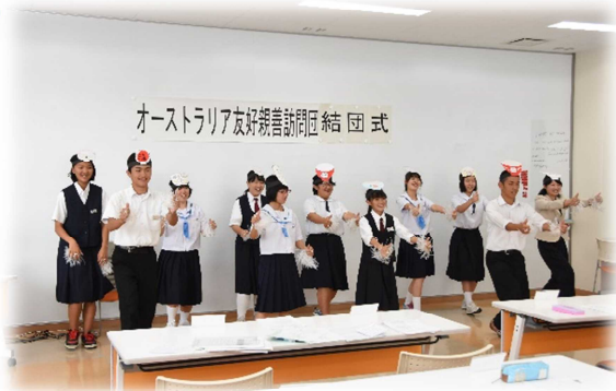
オーストラリア友好親善訪問団 結団式

7月14日、「オーストラリア友好親善訪問団」の結団式が行われました。この事業はこれまで白石市と国際姉妹都市を締結していたオーストラリア・ハーストビル市の交流事業として、本市へ友好親善訪問団を派遣していたもので、同市が隣接市のコガラ市と合併したことにより、本年はオーストラリア友好親善訪問団として派遣するものです。今年度は日本と強い繋がりのあるカウラ市でホームステイと学校体験入学を行います。