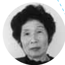
ヘルスマイト白石