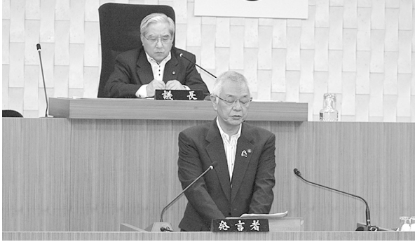
市長の提案理由説明

請願第1号については、委員長報告を行った後、討論が行われ、表決の結果、賛成者少数で不採択となりました。（※討論の内容と議案の賛否は、5ページに掲載しています。）また最終日に、市長提出議案1件が追加提案され、質疑を経て、表決の結果、全会一致で可決しました。