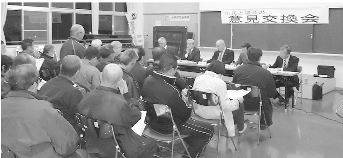
小原公民館での様子（意見交換会）

刈田病院で分娩ができなくなるという噂が流れている。里帰り出産を希望している人もいるので、継続できないか。