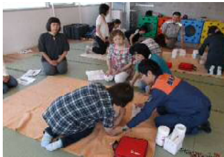
(昨年の講習会の様子) →