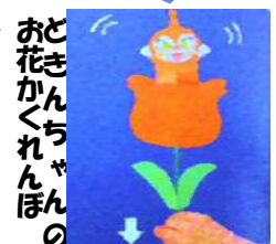
おどろきかくれんぼの