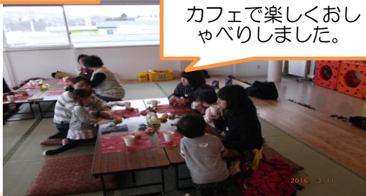
カフェで楽しくおしゃべりしました。