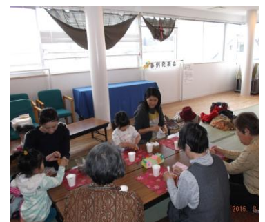
お茶とケーキを頂きながら会員同士でおしゃべりしました

自分自身の子育ての初心を思い出しながら、皆さんが安心して子育てができるようにサポートしていきたいと思っています。よろしくお願ひいたします。