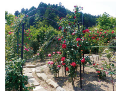
▲5月下旬の日下さん宅のお庭