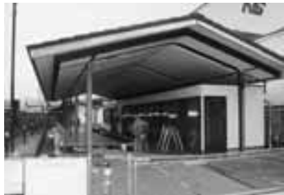
▲建設の進む(仮称)中町ポケットパーク

○施設の手前に、雨天でも利活用できるスペースを確保した大屋根施設を配し、その中に多目的に利用できる板の間と、地場産品などを展示販売するテナントを一体的に整備しました。