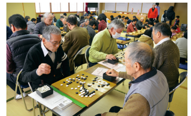
▲真剣な表情で対局をする参加者たち

大会は、実力に応じてそれぞれグループに分かれ対戦。会場のあちこちで、白熱した対局が繰り広げられました。参加者は「市外からの参加も徐々に増えて、伝統のある大会になってきました。毎年、楽しく参加しています」と笑顔で話してくれました。