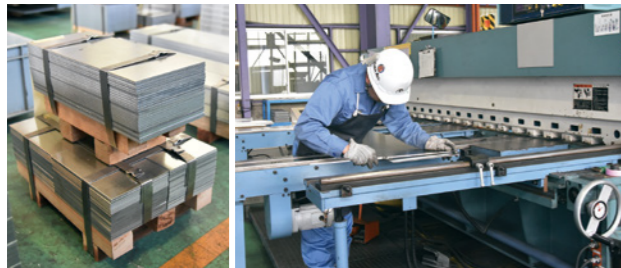
▲出荷を待つ鋼板 ▲高精度の機械で加工しても最後は「人の目」で確認を行う