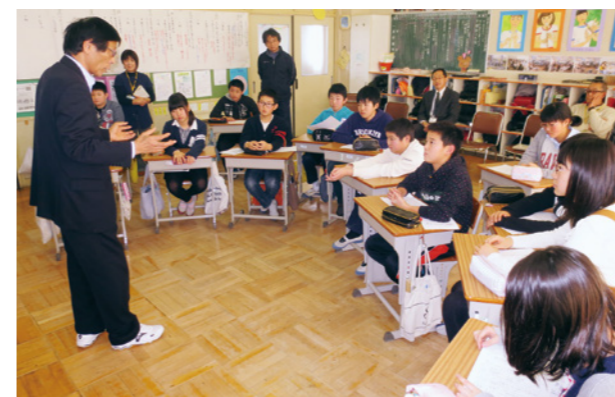
▲人権擁護委員と人権について一緒に考える児童たち

教室後の感想文には「努力している人を尊重していれば素晴らしい社会になる。ほかの人のことを尊重し合い、自分の個性を大切にがんばっていききたい」など、人権について真剣に考えた様子が見られました。