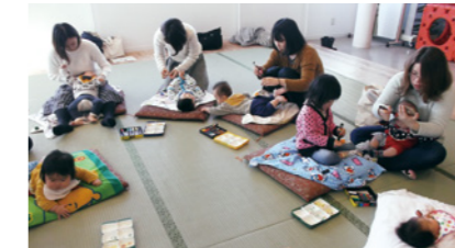
▲ニコニコるーむでこまづくりをする参加者たち

年齢・月齢ごとに分かれる「一む」で、親子あそびやママたちの交流などが楽しめます。