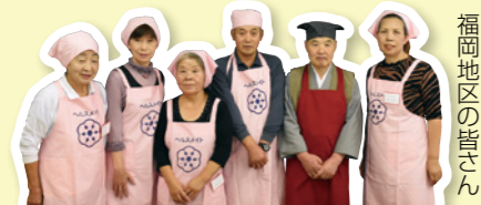
福岡地区の皆でん