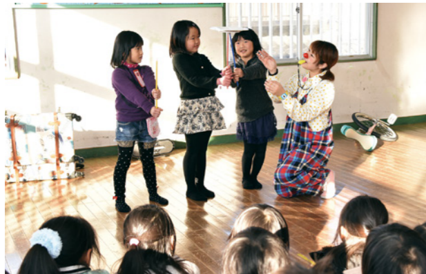
▲クラウンあんさん（右）のパフォーマンスに参加する児童たち

参加した児童は「一輪車で縄跳びがすごかった。マジックもどうなっているのかとても不思議です」と笑顔いっぱい話してくれました。