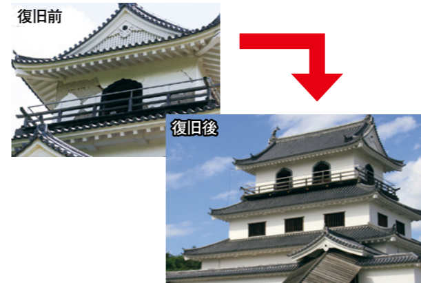
▲外壁の漆喰はがれ、亀裂が入るなど大きな被害を受けた白石城も震災前の姿を取り戻しました

建物や道路など公共施設の復旧はほぼ終了しています。下水道施設に一部震災直後には発見できなかった被災箇所があり（南町・東町・旭町地区など）、平成27年度末までの完成を目指し、復旧工事を進めています。