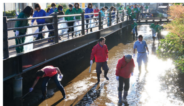
▲沢端川清掃の様子

毎年、春と秋の川干に合わせて、白石市観光協会と白石商工会議所の共催でボランティアを募り、沢端川の清掃奉仕作業を行っています。残念ながら毎回、たくさんの空き缶やペットボトル、ゴミなどが回収されます。キレイな沢端川をつくるためには皆さんの力が必要です。美しい城下町「白石」を守るため、川干清掃へのご協力をお願いします! 【服装・持ち物】 ①汚れても良い服装で、長靴を履いてお越しください。 ②火ばさみのある方はご持参願います。 ③軍手とゴミ袋は主催者側で用意します。