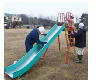
▲除染作業（遊具のふき取り）の様子

これまで「子ども空間」の除染作業を優先的に行うとともに、民有地の除染作業も行ってきました。平成27年度には、民有地除染の事後モニタリングを行うなど、市民の安全・安心確保に努めています。