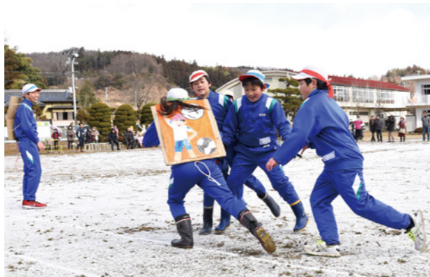
▲うっすら雪が積もる校庭を元気に走り回る児童たち

2月10日、横約40cm、縦約50cmの大きな絵札を背負って逃げる児童を追いかける、白川小学校の冬の恒例行事「動くジャンボカルタ取り大会」が同校で行われました。この日は全児童61人が参加。学年縦割りの4チームに分かれて絵札の獲得枚数や絵札の出来栄などで得点を競いました。今年のテーマは「学校」で、絵札や読み札はすべて児童たちの手作り。児童たちは、当日の朝に降り出した雪がうっすらと積もった校庭を元気に走り回っていました。また、今春に同小へ入学予定の園児なども一緒に参加し、交流を深めていました。