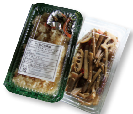
▲人気の「おこわ」と「きんぴら」

今月は、上記人気農産物のほか、彼岸花(削り花)、ふきのとう、お総菜がオススメです。