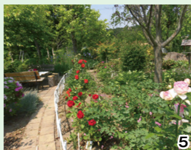
4・5_昨年のオープンガーデンの様子