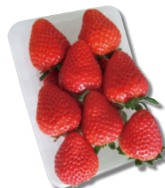
▲売切御免の「シリウスいちご」

月1回の「サービスデー」(定期市)を月初めの販売日に開催します。お買い上げ金額にかかわらず、好きな新鮮野菜を1点サービス! あま～い「シリウスいちご(もういっこ)」(※数量限定)は、