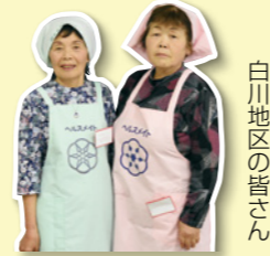
白川地区の皆さん