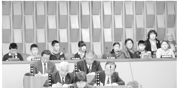
12月定例会を傍聴した大平小6年生