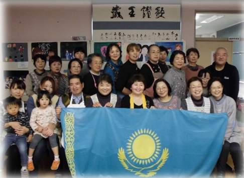
▲カザフスタンの国旗と一緒に…。