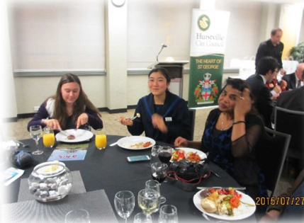
▲▼懇親ディナー@ハーストビル市役所