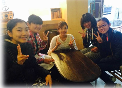
▲セーラ先生と再会。シドニーで！(^^)!