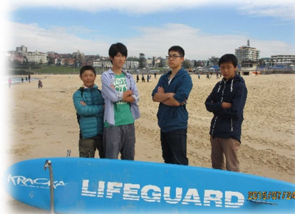
▲「俺たち、ライフセーバー！...ではありません。」