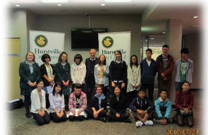
▲みんなで...@ハーストビル市役所