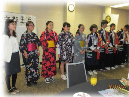
▲懇親ディナーで習字・大喜利・歌を披露！