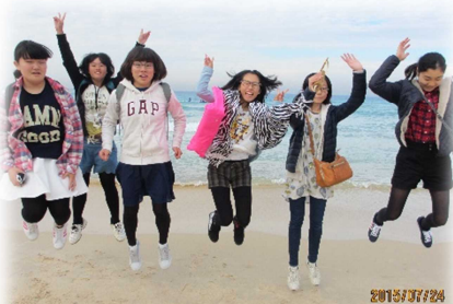
▲イエーイ！@ボンダイビーチ

姉妹都市ハーストビル市への市内中学生派遣事業として、生徒 10 名と引率 2 名の訪問団が、7 月 23 日から 8 月 2 日の日程を終え帰国しました。今号は滞在の様子と生徒の感想などを紹介します。