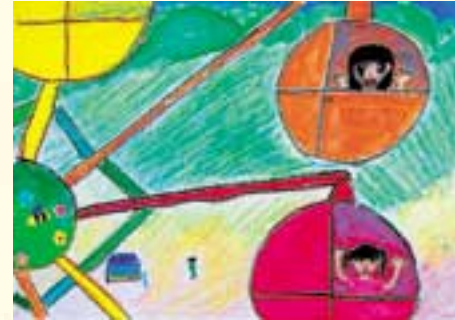
「はじめて乗ったかんらん車」