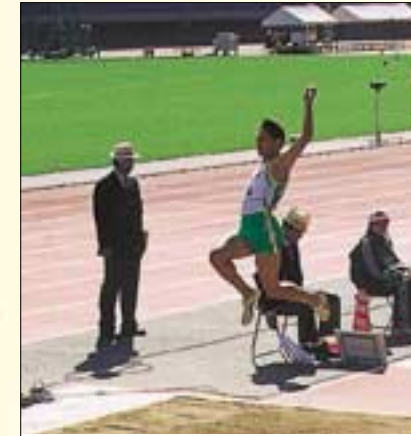
みやぎ国体での跳躍 (宮城スタジアム)