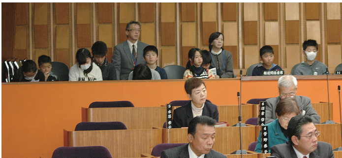
12月定例会を傍聴した大平小6年生

人事院勧告に基づく国家公務員の給与と制度改定に準じて、条例で定める職員の給与・通勤手当・12月期の期末手当の引き上げについて、条例の一部を改正するものです。