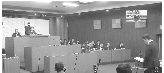
議場での一般質問の様子