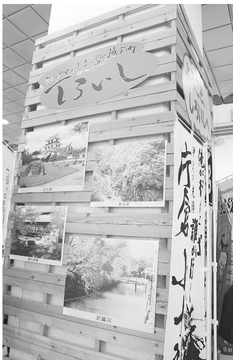
改修となる観光案内板

〔答弁〕国際化を見据えた場合、観光案内板も整備していかねければならないが、Wi-FiやSNS(ソーシャル・ネットワークキング・サー