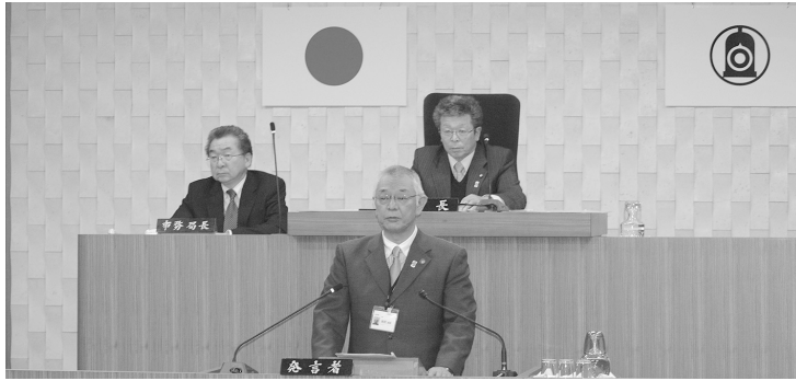
市長の提案理由説明

また同日、議員提出議案4件が上程され、表決の結果、全会一致で原案のとおり可決しました。