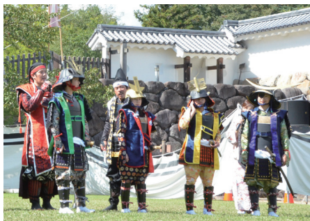
鬼小十郎まつり（子ども武将隊）