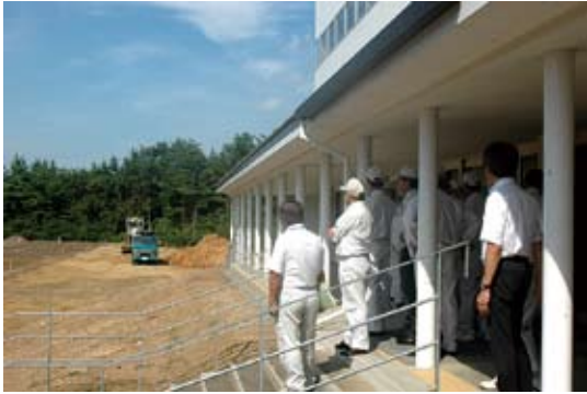
特別委員会現地視察(南中除染状況)