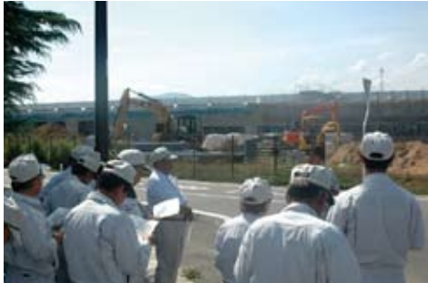
特別委員会現地視察(白石インター工業団地関連道路)