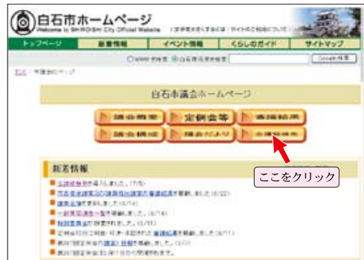
▲市議会のホームページから【会議録検索】をクリック