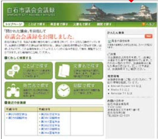
【白石市議会会議録】トップ画面へ