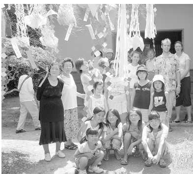
七夕まつりの様子(武家屋敷)

労働基準法の改正により、職員団体のための職員の行為の制限についての特例として、「時間外勤務代休時間」を加えるという、条例の一部改正です。