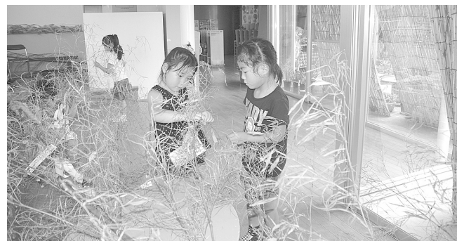
「願い事」かなうといいなあ！(北保育園)