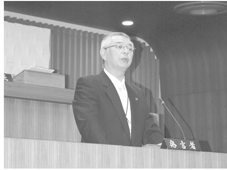
市長の提案理由説明

平成22年6月定例会は、6月14日から6月25日までの12日間の日程で開催されました。市長提出議案は、人事2件、条例4件、平成22年度各会計補正予算4件など計10件でした。このうち、人事案件2議案については、委員会付託を省略し表決の結果、全会一致で初日に同意しました。条例4件は所管の常任委員会、各会計補正予算4件は予算審査特別委員会にそれぞれ付託して審査を行いました。その後定例会最終日の本会議において、各委員長報告を行った後、表決の結果、いずれも全会一致で原案のとおり可決しました。一般質問では12名の議員が質問に立ち、当局の考えを質しました。