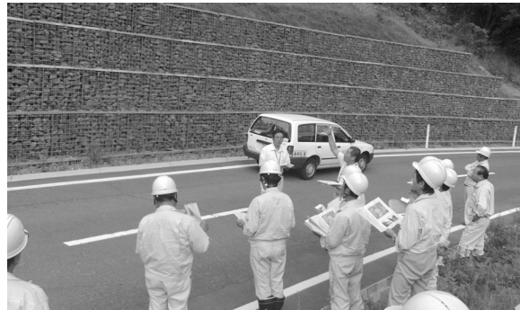
決算審査特別委員会現地調査

そのような経営状況下で、水道事業は公営企業であるから、独立採算が求められるが、収益でもって経営をしていかなければならないので、今後種々検討してまいりたい。