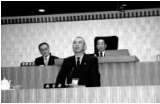
市長の提案理由説明

補正予算については予算審査特別委員会に付託され、第88号議案・白石市外二町組合規約の変更についてから、第108号議案・白石市特定公共賃貸住宅条例の一部を改正する条例までの21議案については、所管の常任委員会に審査が付託されました。