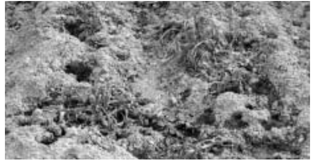
食害にあったジャガイモ畑（小原）