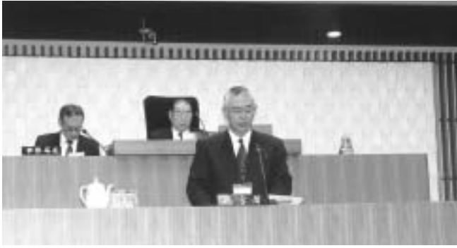
市長の提案理由説明

各委員会で審査を経て、定例会最終日（12月21日）の本会議で各委員長報告を行い、第118号議案については、少数意見の報告がありました。第118号議案から第121号議案までの計4議案については、反対及び賛成の討論があり、表決の結果賛成多数で、残る