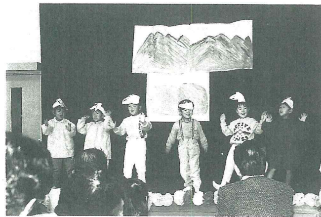
おじいちゃん・おばあちゃんと遊ぶ会

10月28日、白川保育園におじいちゃん・おばあちゃんを招き、劇や楽器の合奏を元気一杯に披露しました。演技の後は、お母さんたちのつくった「イモ煮」を食べ、楽しい一日を過ごしました。