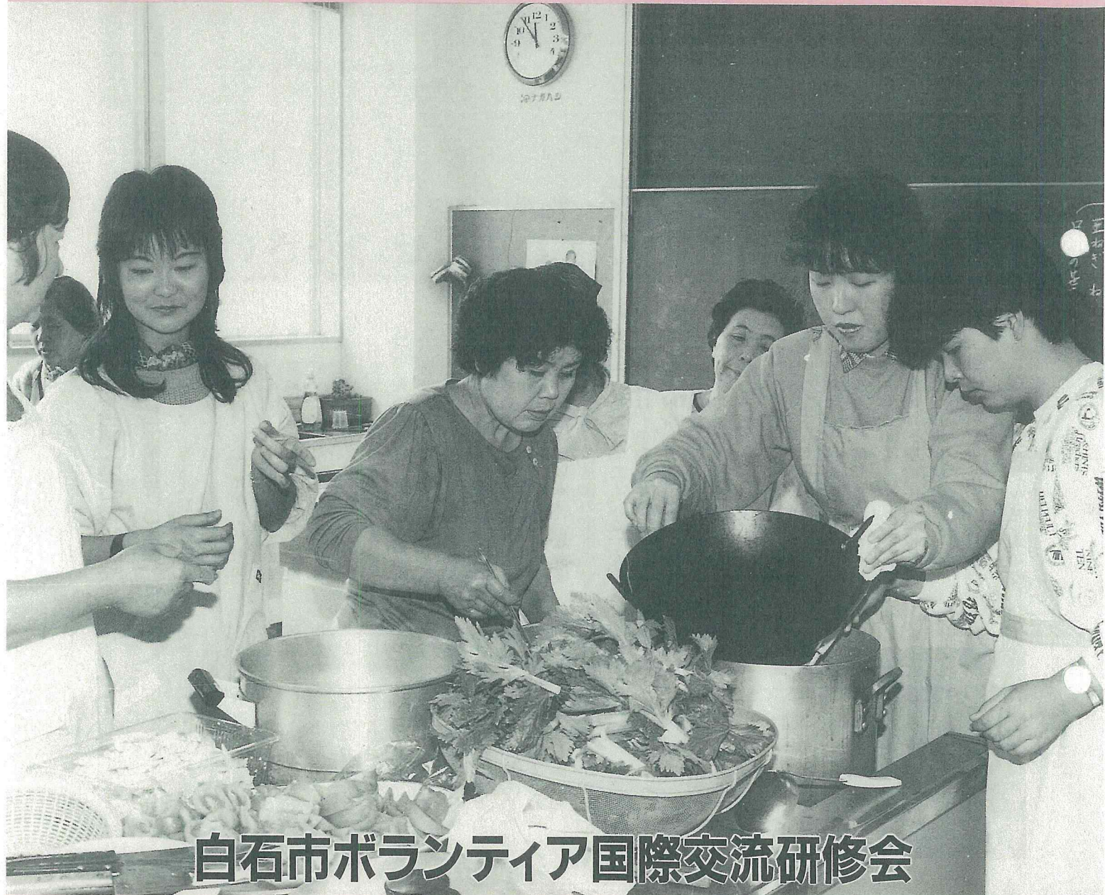
白石市ボランティア国際交流研修会