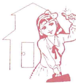
戸締りを忘れずに

酒を飲む機会が多い時期です。酒を飲んだうえのケンカや事件・事故に巻き込まれないよう、くれぐれもご注意ください。 飲酒運転は、しない・させないみんなが協力し合って、悲惨な事故を防止しましょう。