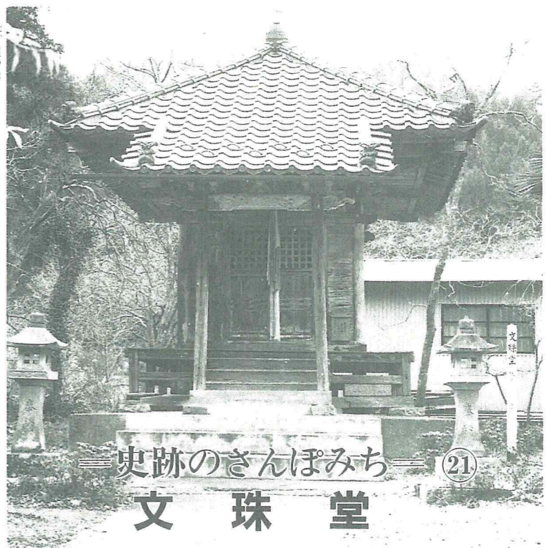
史跡のさんぽみち 21 文珠堂

七日、顕信卿（北畠 三沢を没落し小手保・大波城間に引き籠る」とある。この頃三沢城は南党の根拠地であったが北党勢に攻められ顕信は三沢城を落ちのび丸森街道を通り阿武隈川を渡り、掛田方面の山間部を抜け、小手保（掛田の南約八キロ）大波（掛田の南西五キロ）城に後退したのである。多賀国府が北党に帰し、奥州の南北朝内乱の前半は終了する。康暦二年（一三八〇）伊達宗遠は長井の庄を領有し、その後、刈田・伊具・亘理郡を領地とした。「伊達正統世次考」明応四年（一四九五）八月三日付けの大町三河守宛伊達尚宗采地証判に「刈田郡見沢藤田方知行所、和田相当の分、替地としてこれを渡し進守」とあり、大町氏がこの頃有力な在地領主であったものと推測される。