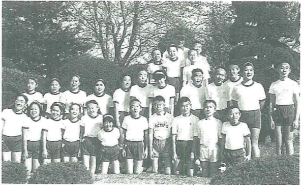
時には、男子と女子の意見の合

例えば、「先生方に会った時、きちんと礼をする」、「業前運動の時、全員が、半そで・短パンで走る」、「朝会するとき、どの学級よりも早くきちんとならぶ」、「廊下は静かに、一列になって歩く」などです。私たちの学級は、男子十二名、女子十六名、計二十八名のクラスです。